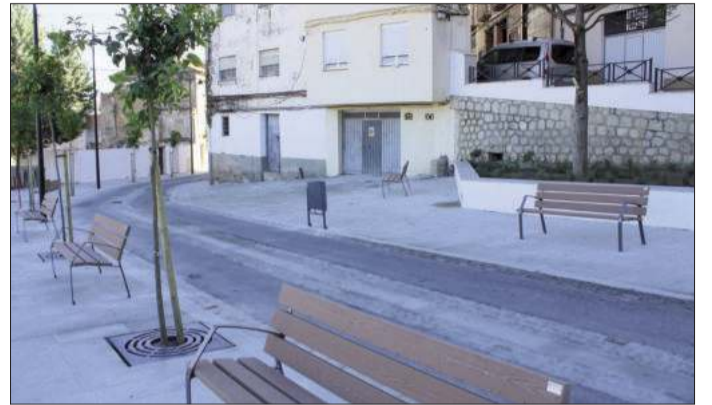
Vecinos y concejales visualizan los últimos detalles de la reurbanización de la calle Real que cuenta con una imagen renovada entre la que destaca una nueva plaza y el acceso a los 25 Caños.