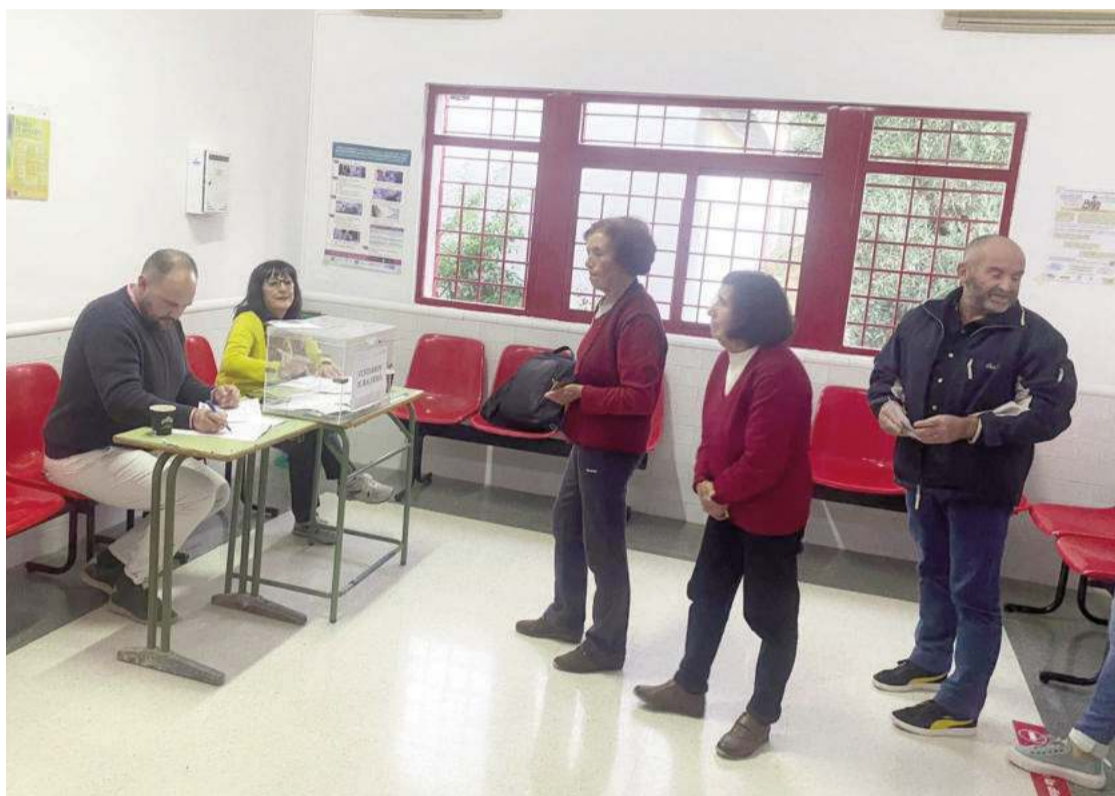
Uno de los colegios que se abrieron para las elecciones en el medio rural.

Según informó la concejalía de Medio Rural, en Venta del