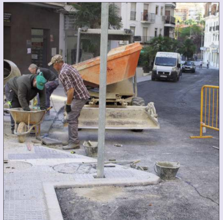
Momento de ejecución de las últimas acciones en la calle Granada.

Gallego también informó de la ejecución de mejora de las escaleras que dan acceso a la plaza aledaña Ibn al-Jatib. Las mismas se han mejorado con una terminación en locería de granito y se han sustituidos los muros por baranda. También se han mejorado los muros de las mismas con terminación en piedra.