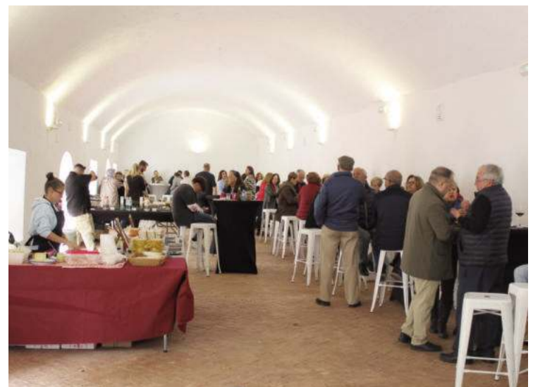
Numeroso público asistió a la II Feria Gastronómica en el Cortijo Las Mozas.

El tapeo inicial se vio aderezado en todo momento con propuestas culturales. A la música ambiental de un saxofonista y un grupo de jazz, se sumó la participación de un tablao flamenco. Ya por la noche se ofertó la ambientación de un dj y un espectáculo pirotécnico.