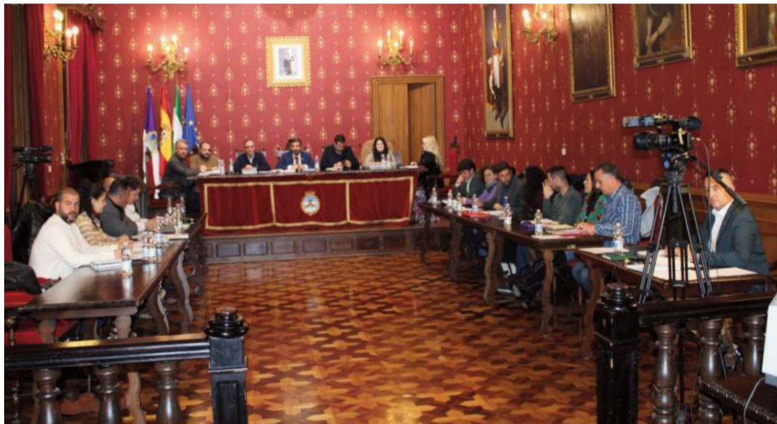
Momento de la sesión plenaria del mes de diciembre.

El alcalde señaló el problema que supone contar con una red obsoleta y antigua. “Nos preocupa eso y el coste que supone llevar el agua a las casas. Loja como municipio tiene mucha agua, pero en unas cotas más bajas de donde está la población y necesitamos bombear el agua para que llegue a las casas de todos los vecinos y eso supone decenas de bombas que funcionan con electricidad”. Según Camacho “hoy Gemalsa está pagando el doble de lo que pagaba a Endesa para llevar el