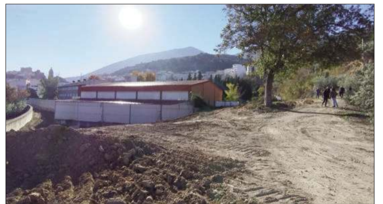
El presidente de la Diputación (en el centro) posa con el alcalde y algunos miembros

La continuidad de la calle Hoyo de Narvéez a la Huerta Don Álvaro se llevará a cabo en una plataforma única con espacio para el paso de peatones e iluminación LED. También se acomete instalación para la evacuación de pluviales. Esta acción se suma al en-