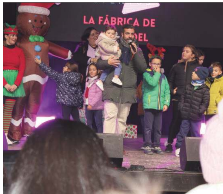
El alcalde inicia la cuenta atrás del encendido de los adornos navideños. P. CASTILLO

Una animación infantil, realizada por la empresa local 'Dajoheca' ha sido la previa del encendido. La cuenta atrás ha sido coreada por numerosas familias presentes que han dado la bienvenida a la Navidad.