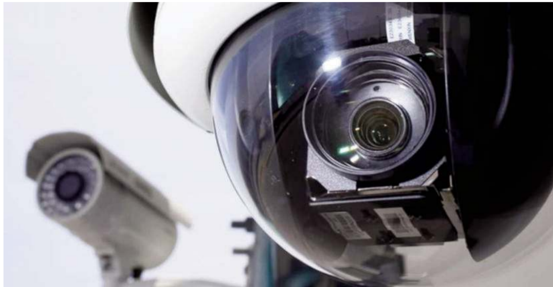
Algunos modelos de cámara de Inteligencia Artificial que pueden servir para el control del tráfico y el tránsito peatonal. EL CORTO

Con un presupuesto total de 140.000 euros, el proyecto contempla la instalación de una veintena de cámaras. Éstas se ubicarían en puntos de especial relevancia para el tráfico y el tránsito de personas. Principalmente se centran en zonas de entrada y salida de la ciudad. Su tecnología les permite ir más allá que aportar una simple grabación. La inteligencia artificial de las mismas facilitará