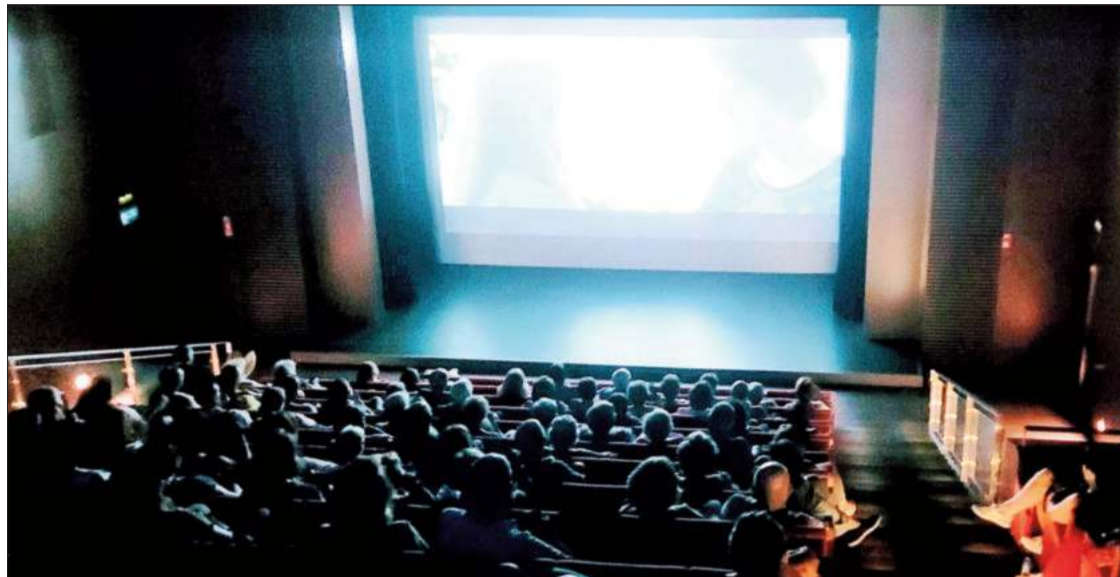
El Teatro Imperial cuenta con un nuevo proyector láser de vídeo de 13.000 lúmenes.

Con un coste de 18.000 euros, mejorará las proyecciones del espacio escénico. El antiguo aparato se instalará en El Pósito