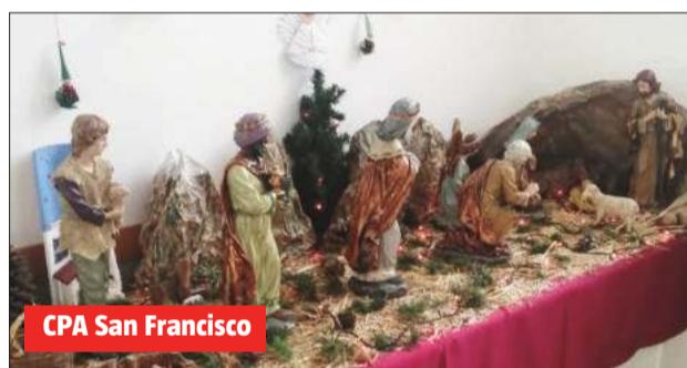
CPA San Francisco