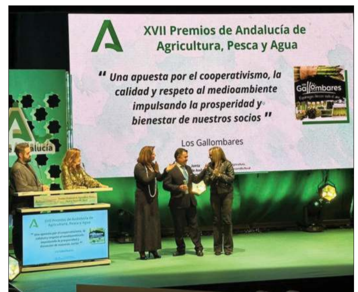
El presidente de la cooperativa en el momento de recibir el premio.

Además de recoger este trofeo, durante la gala Abades y 360° MC llevaron a cabo un divertido juego de marketing digital en el que los participantes debían responder a las preguntas del "Rosco de Pasa por Loja" para ganar el conocido dulce.