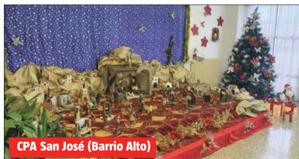
CPA San José (Barrio Alto)