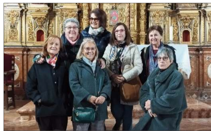
La profesora (dcha.), junto a sus antiguas alumnas en Santa Clara.

Para terminar el evento tuvo lugar una rifa solidaria de productos donados.