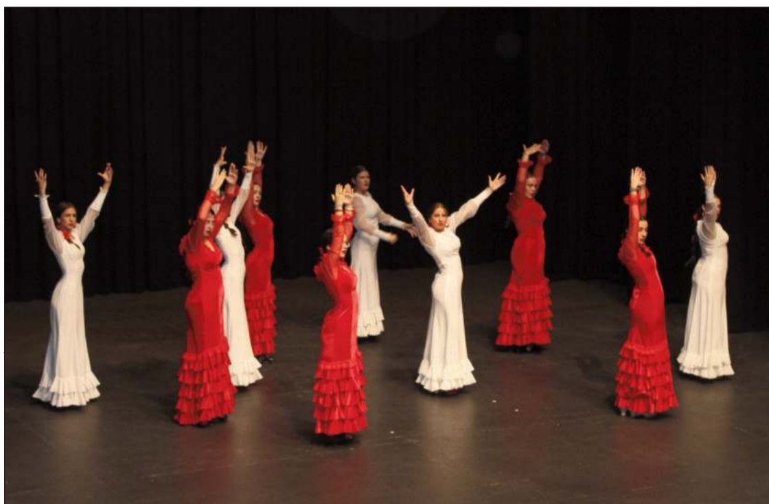
Una de las actuaciones de baile flamenco que dieron forma a la III Gala por la Fibromialgia.