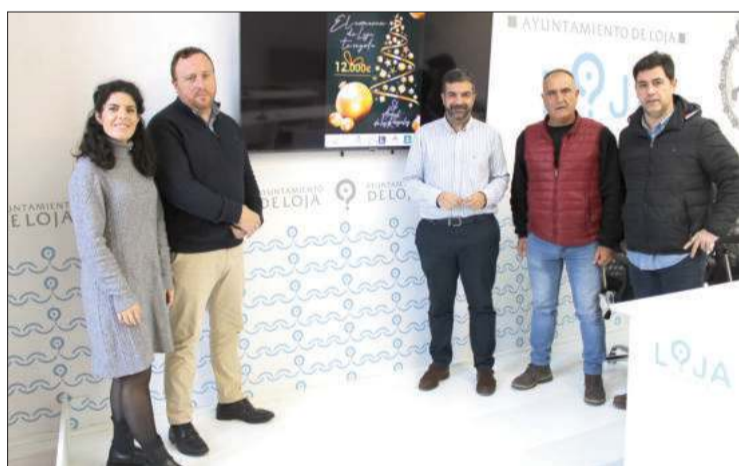
Responsables políticos y comerciales en la presentación de la campaña.