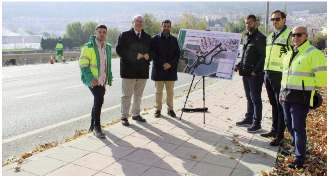
El presidente de la Diputación (en el centro) posa con el alcalde y algunos miembros del equipo de Gobierno.

“Es una obra más de inversión de la Delegación de Fomento en Loja”, llegó a afirmar Ayllón que destaca como se está finalizando la creación de la estación de autobuses y se inicia otra mejora más para la ciudad. El delegado recuerda que en estos momentos de actúa en la finalización de accesos a la A-4154 y en la colocación de pantallas anti ruido en la A-92 a la altura de Cuesta La Palma. “Cumplimos con nuestros compromisos”, llegó a aseverar el delegado que