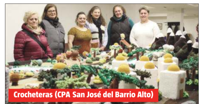
Crocheteras (CPA San José del Barrio Alto)