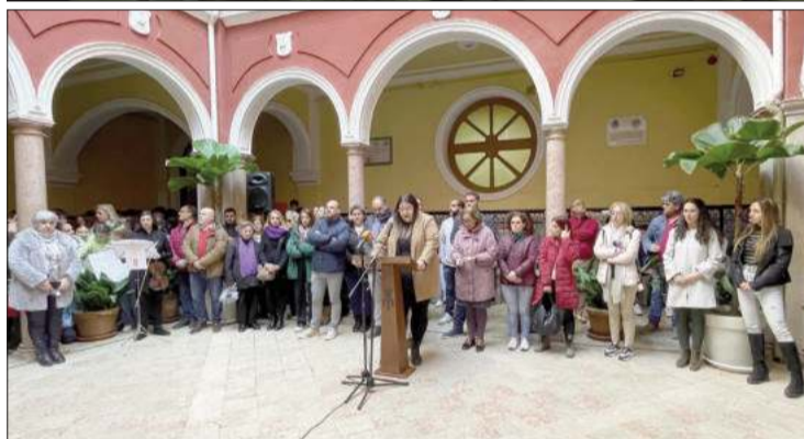
(A la izqda.) Poste de los valores entre Cuesta del Arca y Avenida de los Ángeles; (dcha) Participantes en el acto institucional de lectura del manifiesto del 25N.