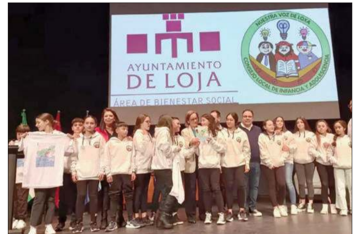
La delegación lojeña que participó en este primer encuentro.

Loja participó el pasado 18 de noviembre en el ‘Primer Encuentro de Consejos Locales de Infancia y Adolescencia’, organizado por la Consejería de Inclusión Social, Juventud, Familias e Igualdad y el Ayuntamiento de Almuñécar.