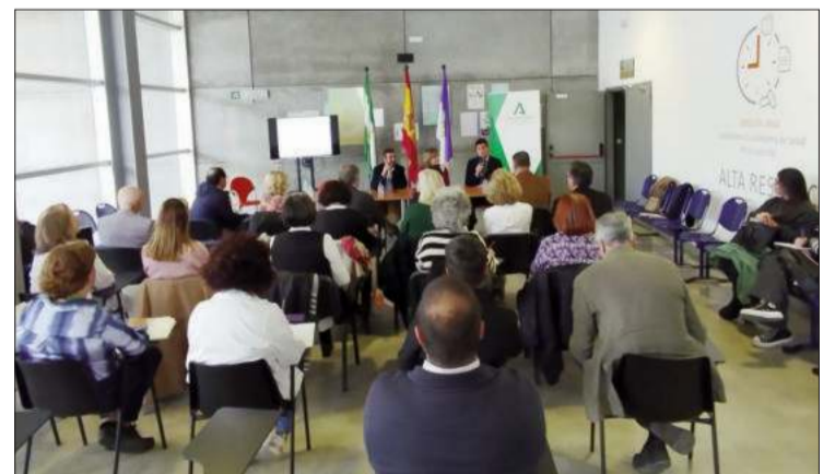
Jornada de explicación del programa en el Hospital de Loja

Por su parte la directora general informó que se trataba de unas jornadas de contacto para conocer los detalles novedosos del programa para la prevención de la depresión y las con-