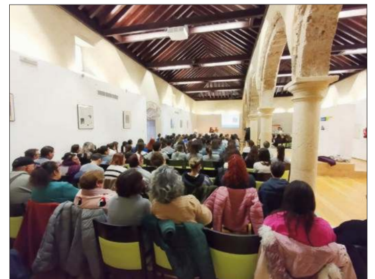
Las jornadas 'Capacítate' tuvieron un lleno absoluto. FOTO: C. M.

Hubo lleno en la sala de las columnas del CIC El Pósito con la presencia de alumnado de centros formativos y educativos de toda la provincia, usuarios de la residencia, profesionales y ciudadanos en general./C. M.