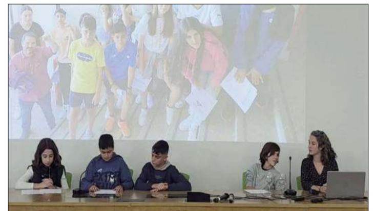
Alumnos que expusieron el trabajo en la Universidad.

En la jornada, bajo el tema principal ‘Mi salud también es mental’, se desarrollaron diferentes talleres y actividades relacionadas con las nuevas tecnologías y las alternativas saludables, la importancia de la salud mental y como no perderla y otras actividades lúdicas por la ciudad sexitana.