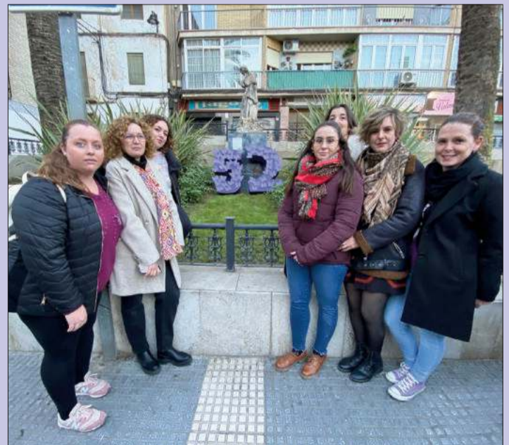
Integrantes del colectivo ‘Loja por la Igualdad’ en su homenaje.