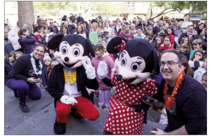
Fiesta fin de año infantil del 2022 en el Parque de los Ángeles.