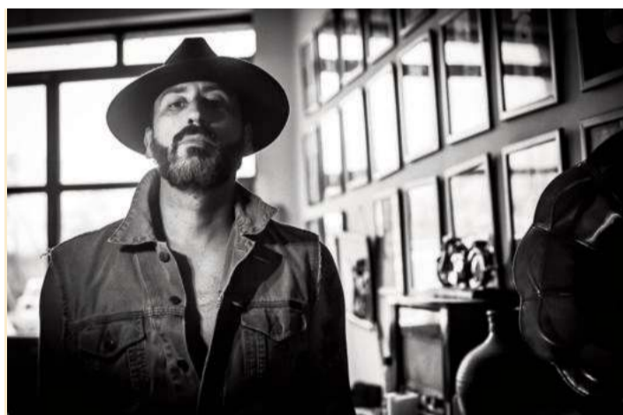
Juan Fernández 'Indio', en una foto promocional de su nuevo trabajo.