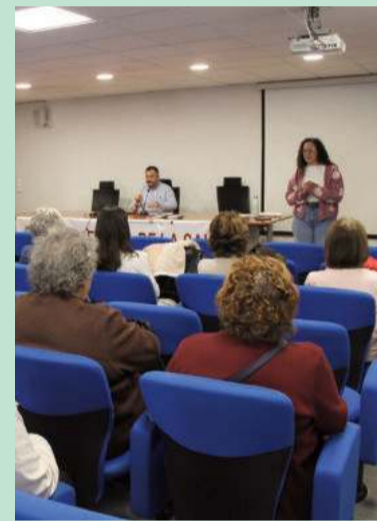
(Arriba), el encuentro en salud congregó a numeroso público; (abajo, de izqda a dcha.), la mañana saludable en el parque de Narváez, la mesa redonda en el Ayuntamiento y el taller sobre bienestar en la edad adulta y la jornada de salud pública.