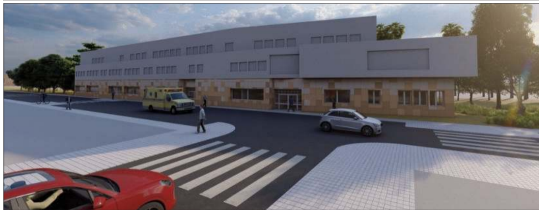
El viceconsejero junto con el alcalde en la visita a unas instalaciones cuya terminación ya se vislumbra.

En este sentido, ha destacado el viceconsejero de Salud y Consumo, “los trabajos de reforma están teniendo en cuenta como premisa la importancia de disponer de instalaciones que propicien la humanización, a través de