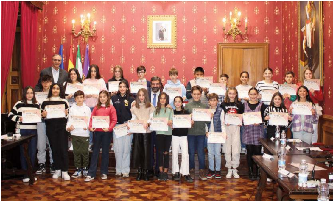
Foto de familia de los niños y niñas que participaron en el Pleno especial con motivo del Día de la Infancia.

El Ayuntamiento de Loja acoge la celebración de un Pleno especial con motivo del Día Internacional de la Infancia el 20 de noviembre