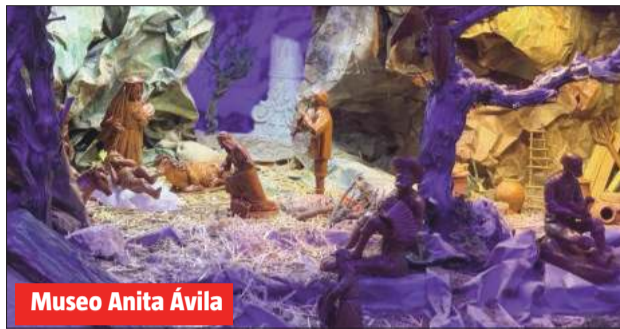
Museo Anita Ávila