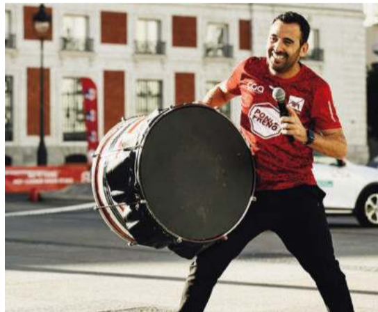
El speaker lojeño se atrevió hasta con el tambor.