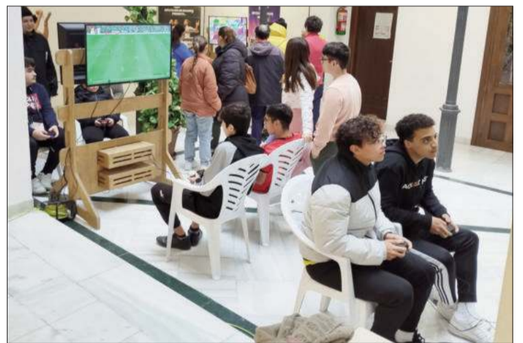
Dipgra Gaming llenó de vida el Espacio Joven.