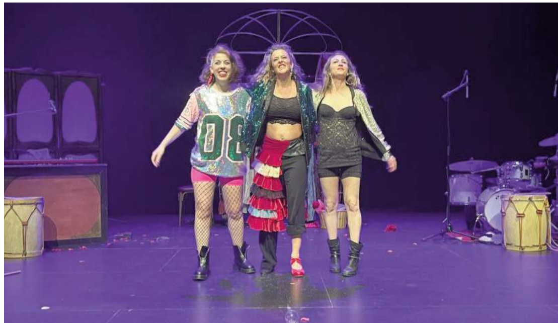
La actriz lojeña (a la derecha) junto a sus compañeras tras la actuación en el Imperial.