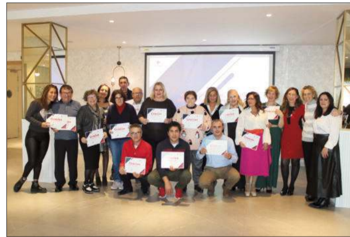
La labor de los voluntarios de Cruz Roja también fue reconocida.