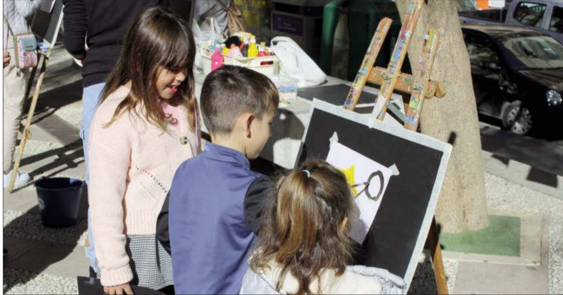
Unos niños crean sus dibujos con acuarelas en una mañana soledada en el Parque de los Ángeles.

La iniciativa se desarrolló con buena participación en el Parque de los Ángeles con variedad de talleres, muestras y exhibiciones para todos los gustos