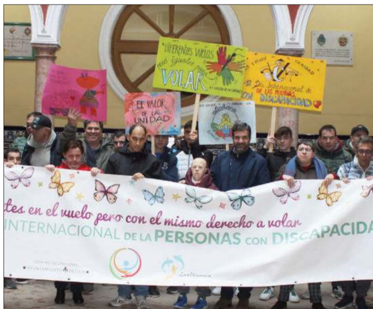
Loja se manifiesta para reclamar una sociedad más inclusiva.