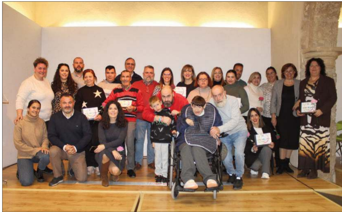
Foto de familia de los galardonados en la tercera edición de los premios 'Inclúyete'.

En cuanto a las empresas, desde el Centro Ocupacional se puso en valor el apoyo prestado por Óptica Conesa. Se reconoció su apoyo al equipo de fútbol inclusivo. Desde esta empresa admitieron que es "un placer colaborar con la labor del cen-