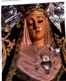
Hermandad de la Santísima Virgen de los Dolores. Antigua Congregación de Terceros Siervos de la Santísima Virgen.

Salida 21:15 Tribuna 00:00 Encierro 01:15