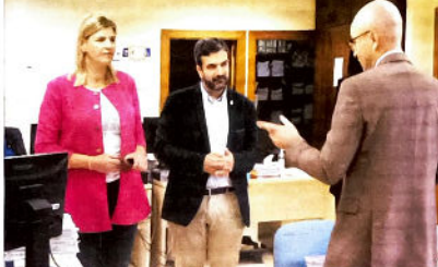
La delegada de Justicia de la Junta y el alcalde de Loja en una visita a los juzgados de la ciudad

Alcalde de Loja agradece el apoyo de la Junta de Andalucía para el mantenimiento de la sala de audiencias y la renovación de la sala de vistas de los juzgados y la actualización de los expedientes y la tramitación de expedientes. Ya no solo es un juez el que tiene que hacer el trabajo, sino que también hay que hacer el trabajo de los juzgados y de los juzgados.