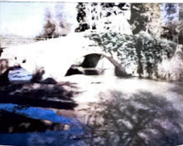
El puente romano de Riofrío será reformado en una semana.

Gómez explicó sobre las actuaciones que consistirán en la limpieza de la estructura y arena movimiento de obra y arena para darle un mejor paso a las aguas por los ojos del puente y