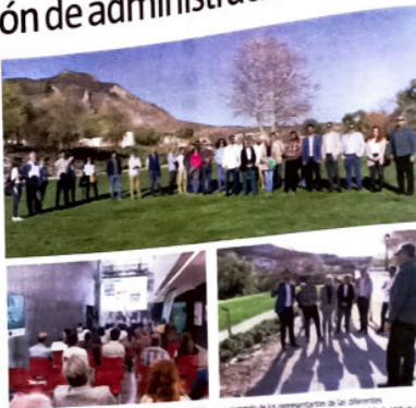
El proyecto 'Paseo del Genil' se ha presentado de forma oficial con un momento de los representantes de las diferentes administraciones por la tarde y a su vez trasladar un momento de la exposición en el Auditorio Alfredo Suárez.

El acto de presentación se ha celebrado en la primera fase implantada por el Ayuntamiento de Loja en la zona del incauzamiento del Río Genil entre los puentes Gran Capitán y Alalaf. También se ha podido observar la zona de nueva actuación no abaj y las medidas que se contemplan. Entre ellas se ha destacado la eliminación de medianas, retirada de matorrales, eliminación de tendidos eléctricos, control de especies invasoras, renaturalización de la ribera,