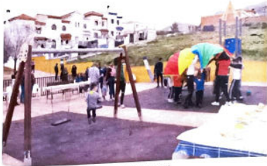
La barriada de Cerro Vidriero en Loja espera su nuevo parque infantil.

Será un edificio diáfano para acoger el desarrollo de diferentes actividades de los vecinos de venta de Santa Bárbara, Cerro Vidriero y Cerro Valnerio. En la planta baja habrá una zona para ascos, un cuarto de instalaciones y un pequeño almacén, y la primera planta está proyectada como almacén. El plazo de ejecución de los trabajos es de cuatro meses.