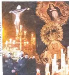
Hermandad de Santísimo Cristo de la Salud y Hermandad del Santo Sepulcro y Niño. Sala de la Salud.

Salida 11:00 Tribuna 13:30 Encierro 14:30