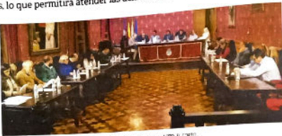
Momento de la sesión del pleno de la corporación municipal del mes de marzo. IZD.

El pleno de la corporación municipal del mes de marzo fue eminentemente económico. Más de 50 puntos en el orden del día han sido votados en centros en la liquidación del presupuesto de 2023. Las cuentas arrojan un balance positivo que permite al Ayuntamiento contar con un remanente positivo de 7 millones de euros, un montante económico que permite invertir al no estar en vagas las reglas fiscales. Con ello, el pleno aprobó un listado con 50 puntos de medio centenar de gastos, subvenciones e inversiones que se crean en atender demandas de servicios, colectivos, barrios, colegios y pedanías.