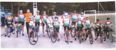
Algunos de los niños y jóvenes que integran esta año el Club Ciclista Lojeño durante una de sus entrenamientos.

El Club Ciclista Lojeño está iniciando durante este mes la nueva temporada tanto en el apartado de su Escuela, como en el resto de categorías, como Portland en esta ocasión hasta la sub-23. El alumnado de la escuela de ciclismo más veterana de Andalucía, pues cumple ya nada menos que 45 años desde que arrancara allá por el año 1978 formando a niños y trabajadores para la base y la carrera del ciclismo.