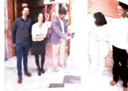
Escuela Oficial de Idiomas.

El objetivo de esta actividad es fomentar el aprendizaje del idioma inglés de una manera divertida y creativa.