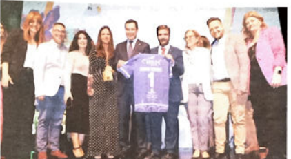
El club Femenino CF recibió el presidente de la Junta de Andalucía una camiseta con su nombre.

«Estoy muy orgullosa y encantada de estar aquí acompañada de mis compañeras y como hace apenas 6 meses no existía nada del club. Esto para nosotros es un orgullo que para ella es un orgullo que para ella es un orgullo que para ella es un orgullo que para ella es un orgullo».