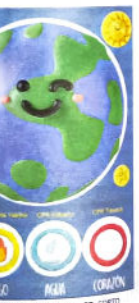
Cartel que anuncia la actividad escolar del próximo 27 de abril.