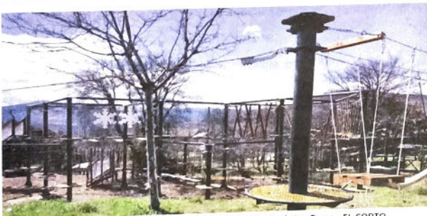
Recreación del Parque de Aventuras que se creará en el paraje de Los Pinos. EL CORTO