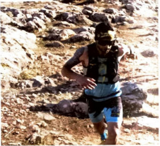
Los atletas disfrutaron de la Sierra, que se mostró perfecta para la gran día deportivo, para la prueba de

La prueba, además de determinar los títulos andaluces de Carreras por Montaña de Linares, es el punto de partida para el Campeonato de España de Carreras por Montaña 2023, y tras ella se celebró en el entorno de localidades desmadrulladas, con la categoría reina de 35 kilómetros puntuable para el Andalucía de Montaña, Abades Stone Race ha incluido también por primera vez una carrera de niños por carretera con 55 kilómetros, además de las habituales categorías con la carrera Media Maratón de 16 kilómetros y la salida para senderistas con 10 kilómetros, que este año se ha celebrado en el otro municipio de la Sierra del Hacho, La Catedral, en el Campamento de Andalucía para juveniles y junior, que debutó con un tiempo de 12 y 10 kilómetros respectivamente, que también ha departado sus campeonatos y campeonatos absolutos. Además, para los corredores puntuables para la Copa de Andalucía, antes de la jornada del sábado, se celebró el capitulo de Medio Kilómetro Vertical, también en la Sierra de Loja, en el que también se coronó como vencedor el propio Zaid Al Makhadmeh.