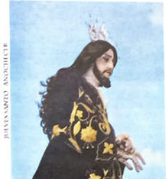
Muy Antigua y Primera Real e Ilustre Cofradía de la Santa Vera Cruz, Jesús Preso y Nuestra Señora de los Dolores.

Salida 10:00 Tribuna 12:30 Encierro 20:00