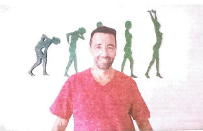
La neuromodulación no invasiva MESA, favorece la relajación del cuerpo y la mente. Disminuye los niveles de estrés y ansiedad, disminuyendo los niveles de cortisol y activa el dolor que impide dormir bien. en area Las Abades, ofrece un café y bollería que favorece a personas en todo el mundo