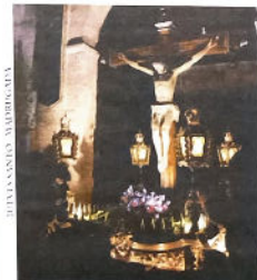
Cofradía del Santísimo Cristo de los Fieles. El silencio.

Salida 18:30 Tribuna 21:30 Encierro 00:30