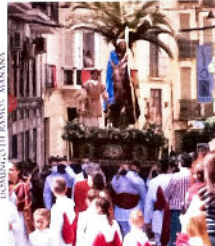
Bornavilla. Hermandad de Nuestra Señora Jesús en su Entrada Triunfal en Jerusalén. Ecce Homo y María Santísima de la Luz.

Salida 21:15 Tribuna 00:00 Encierro 01:15