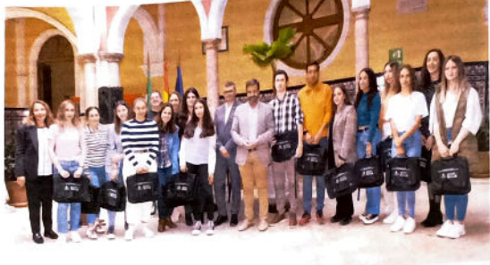
El delegado de Empleo, el alcalde y la concejala de Desarrollo, junto a los jóvenes que participan en este programa de formación y prácticas.