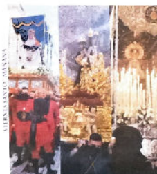
Hermandad de Santa Marcella la Virgen lojeña, de Jesús Nazareno y San Juan Evangelista y Hermandad de la Santa Vera Cruz y Niño. Sala de los Angustias.

Salida 21:00 Tribuna 22:00 Encierro 02:00