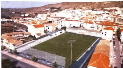
Aspecto de la tierra y renovado campo de fútbol San Francisco, con césped artificial, nuevos vestuarios, graderío y iluminación.

«Es, precisamente, el momento de llamar a participar del acto a cuatro personas que han estado vinculadas al Loja CD como jugadores, en-