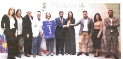
Representantes del Ayuntamiento de Loja y del club Femenino CF en el momento de la entrega del premio Meridiana por su iniciativa deportiva dirigida a niñas.

«Estoy muy orgullosa y encantada de estar aquí acompañada de mis compañeras y como hace apenas 6 meses no existía nada del club. Esto para nosotros es un orgullo que para ella es un orgullo que para ella es un orgullo que para ella es un orgullo».