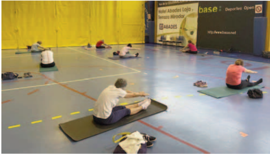
Una de las clases en el pabellón municipal en la vuelta a la actividad tras el confinamiento.

Y es que Deportes ha retomado la actividad con cuatro disciplinas, como son spinning, pilates, aeróbic y yoga, que ya están disfrutando los primeros lojeños. Lógicamente, con las pertinentes medidas sanitarias y de distanciamiento a que obliga la situación actual. Así, el spinning se imparte los lunes, miércoles y viernes a las 8.30 horas de la mañana; el aeróbic los mismos días a las 9.15 horas; pi-