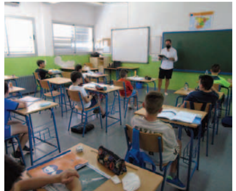
Una de las clases que se imparten en el colegio Pérez del Álamo.

Las clases de apoyo son impartidas por el profesorado del propio colegio, en horario de mañana, de 9 a 14 horas. La jornada escolar comenzará con un taller de actividad físico-deportiva y hábitos de vida saludable, seguido de refuerzo lingüístico o razonamiento matemático y expresión en inglés.