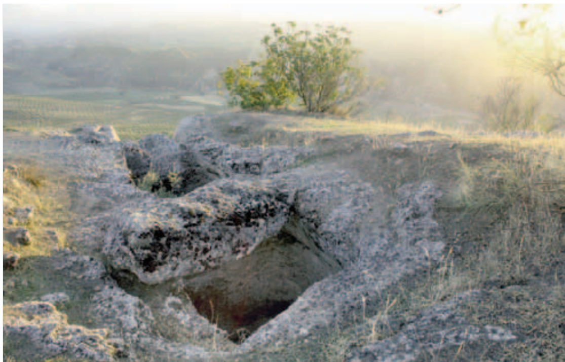
El yacimiento arqueológico de Sierra Martilla será el escenario este año de la Noche Celeste.

Para intentar revertir esta situación, las agencias de viaje