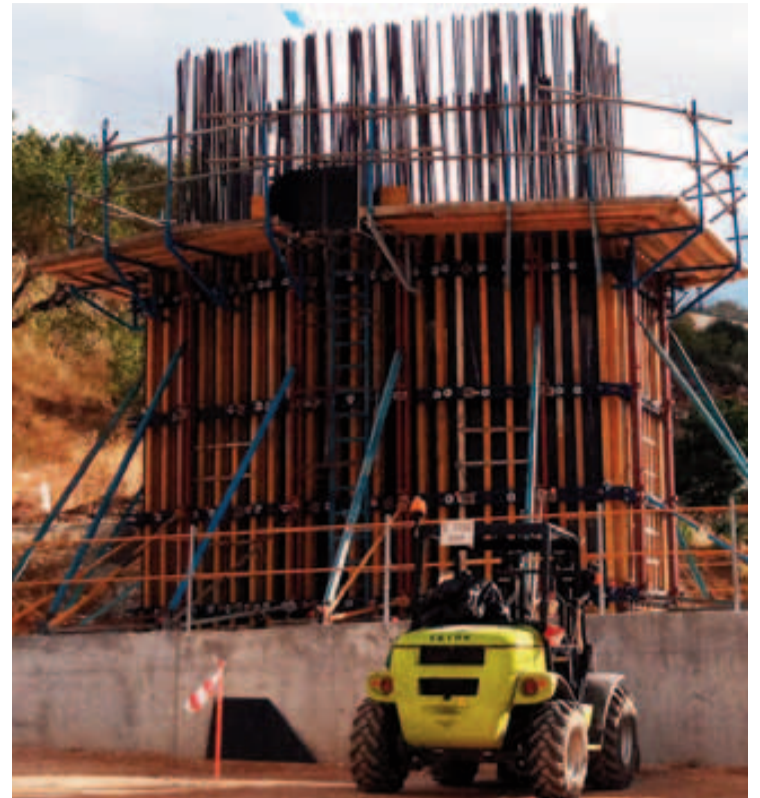
En estos momentos se actúa en el viaducto de la Atajea.

Desde Granada ven la Variante de Loja como solución al descenso de la velocidad que viven los trenes en su entrada al poniente. El paso actual del AVE a 40 kilómetros por hora a su paso por el Barrio de San Francisco fue de