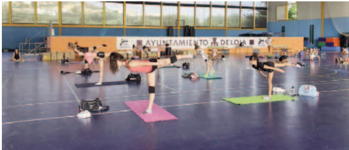
Se han establecido medidas de distanciamiento entre las gimnastas para llevar a cabo los entrenamientos.