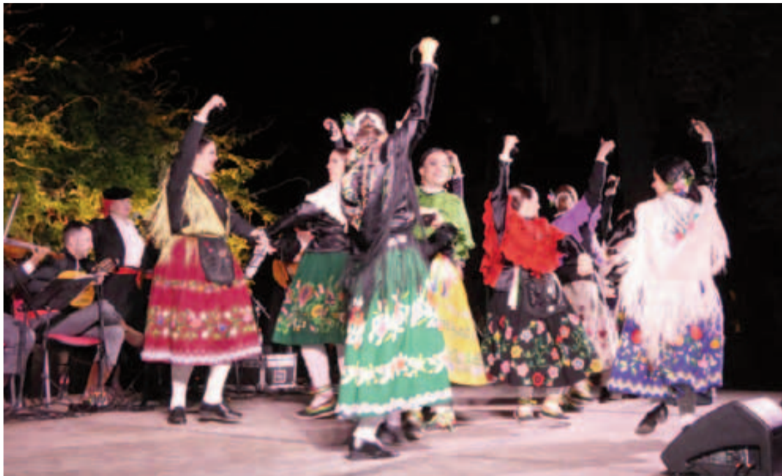
El 'Estío' no podrá celebrarse este año, pero si habrá propuestas culturales puntuales.

Loja no podrá contar con las actividades del 'Estío', pero sí habrá ofertas lúdicas puntuales como un festival flamenco