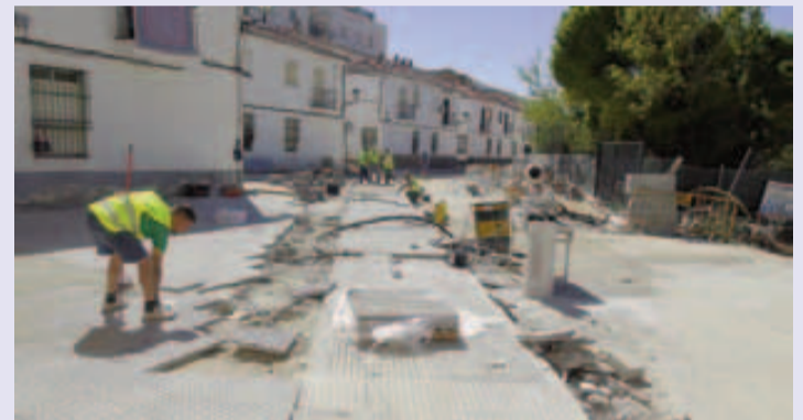
(Arriba), Operarios trabajan en la escalera de El Terciao (izq.) y otros trabajadores actúan en el muro del Cementerio Municipal; (abajo), avanzan a buen ritmo las obras en la Calle Alta de San Roque (izq.) y en la parte final de la Calle Cervantes.