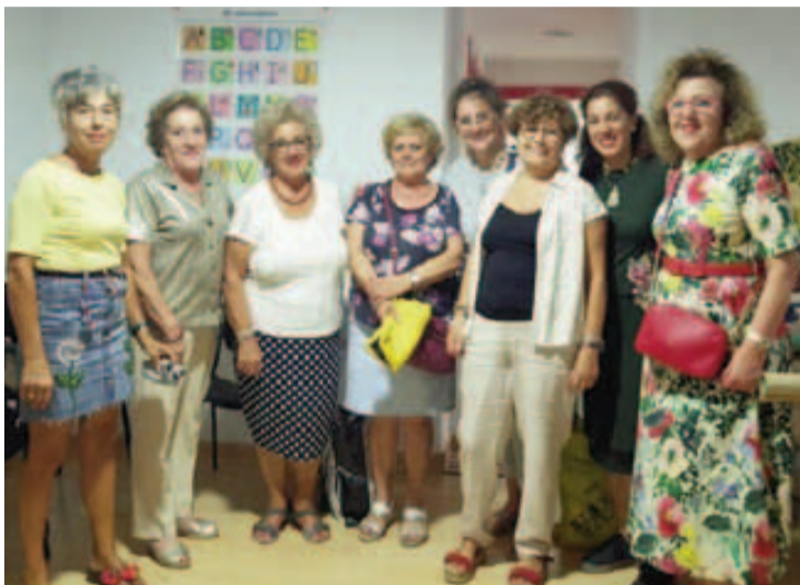
Algunas de las participantes en este taller solidario.

Como en mercadillos anteriores, se contará con numerosos artículos y objetos realizados artesanalmente y a precios muy económicos. Auténticas maravillas cuyo valor, desde luego, es muy superior al que se fijará para su venta. Y es que podrán encontrar desde ropa de bebé, hasta manteles, delantales, bolsas para diferentes usos, muñecos para adorno, mascarillas, óleos donados por Andrés