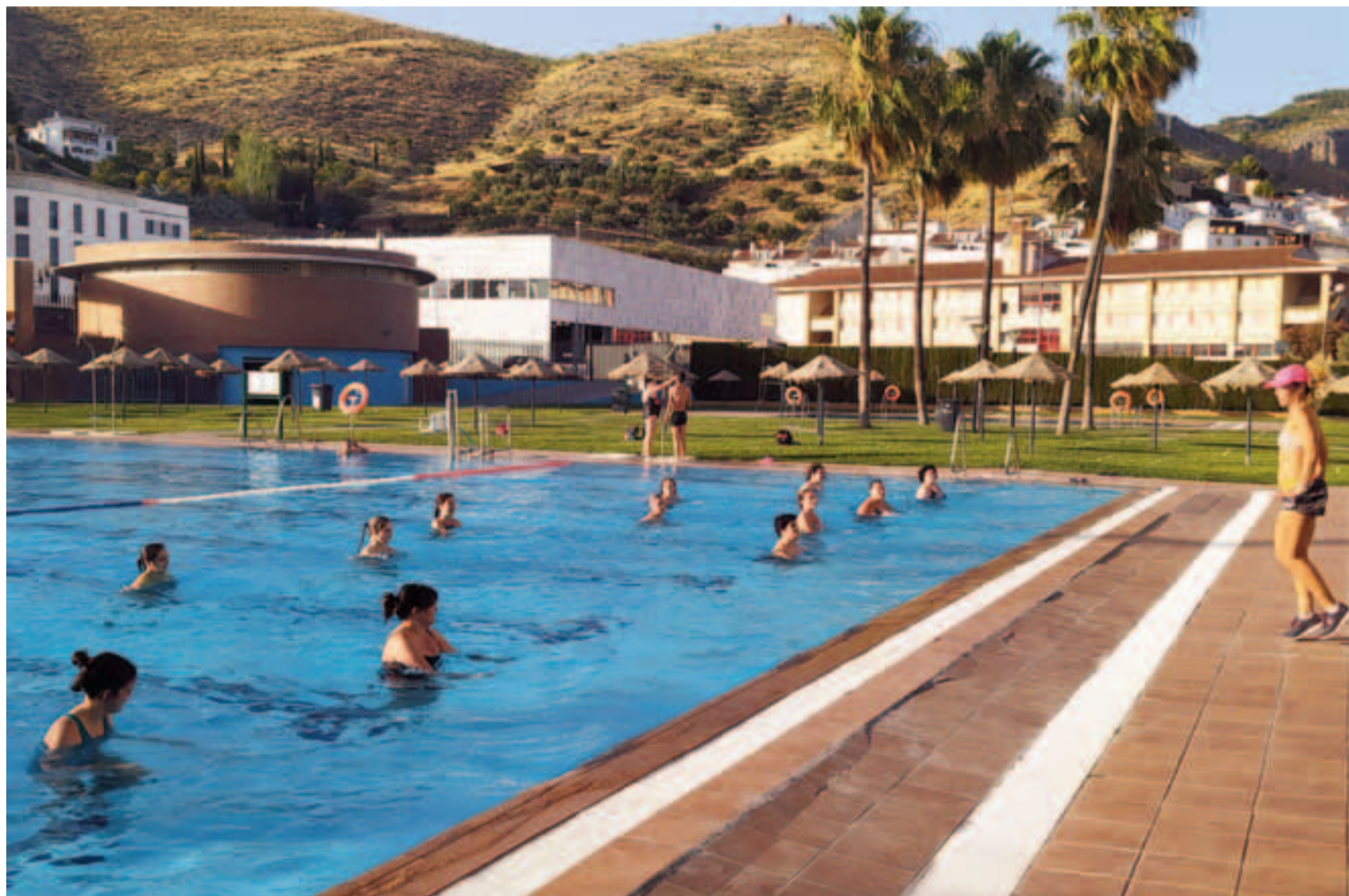
El complejo de Piscinas 'Genil' acoge ya desde este miércoles las actividades de la Campaña de Verano, como el aquaerobic, en la imagen.

Para más información e inscripciones en el pabellón municipal 'Miguel Ángel Peña' y en los teléfonos mencionados.