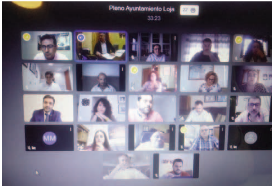
Momento del último pleno telemático del Ayuntamiento de Loja, el próximo será presencial.

En relación al número de habitantes que tiene Loja a fecha 1 de enero de 2020, se expuso que el municipio subió en cerca de cien personas sus ciudadanos. En total se cuentan con 20.419 personas empadronadas. El alcalde afirmó que son