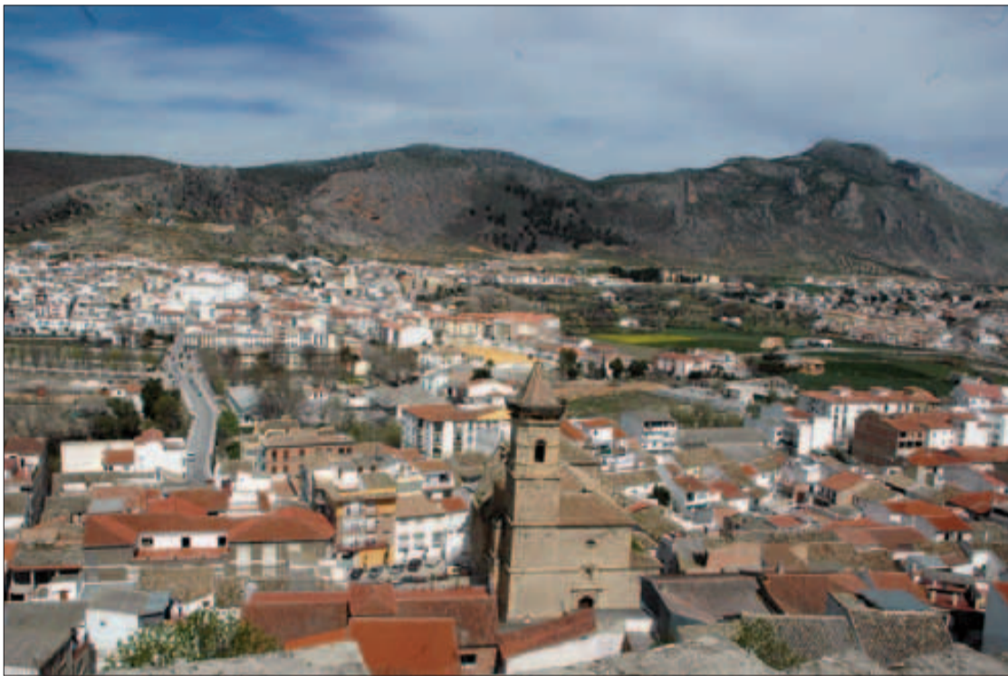
El municipio recibirá una inyección de unos 315.000 euros de los planes de empleo de la Junta.

Los proyectos que desarrollen los ayuntamientos tendrán