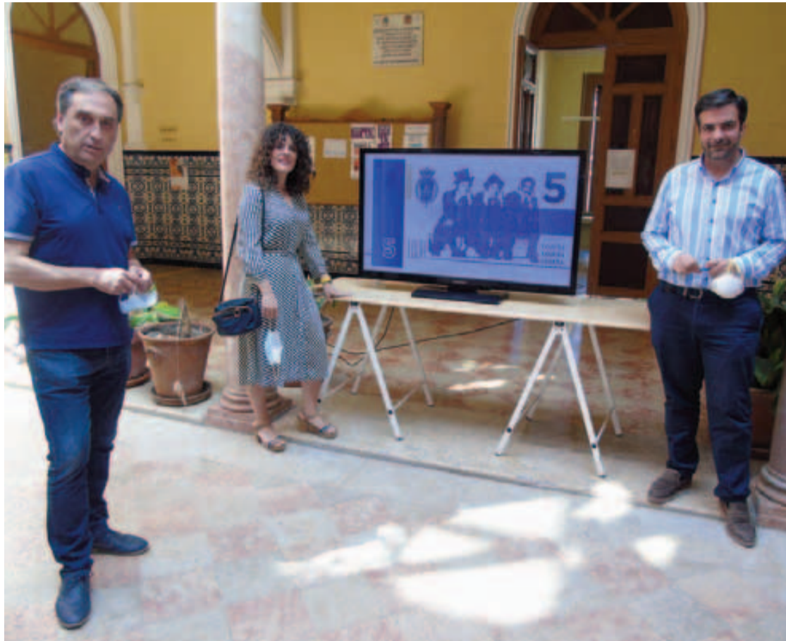
Presentación del vídeo promocional de la campaña de comercio en el patio del Consistorio lojeño.

A continuación, se pudo visualizar el vídeo promocional. El mismo versa sobre un homenaje a las lojeñas, reseñando su fuerza y versatilidad. El spot mezcla la grandeza monumental y natural del municipio con la aparición de diferentes lojeñas de varios ámbitos. Todo queda abierto al final advirtiendo que pronto conoceremos lo que vale una lojeña. La respuesta se vislumbra con la aparición de