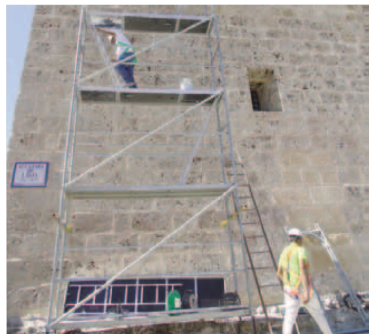
Momento de la colocación del andamio de acceso a la torre.