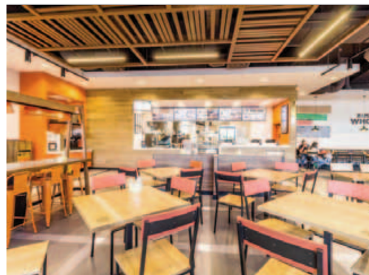
Uno de los restaurantes Burger King que gestiona el grupo lojeño.