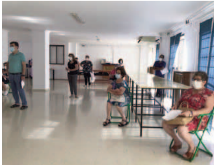
Familiares que asistieron a la reunión del centro ocupacional.

También se informó que en julio se reanudará la asistencia presencial pero de un grupo reducido de personas, con lo que se conseguirá llevar a cabo una atención individualizada. En esta línea se fomentarán los paseos y otras actividades que el usuario pueda hacer sin contacto con otros compañeros. Desde el Ayuntamiento de Loja, y con el apoyo de los profesionales del centro, se han implan-