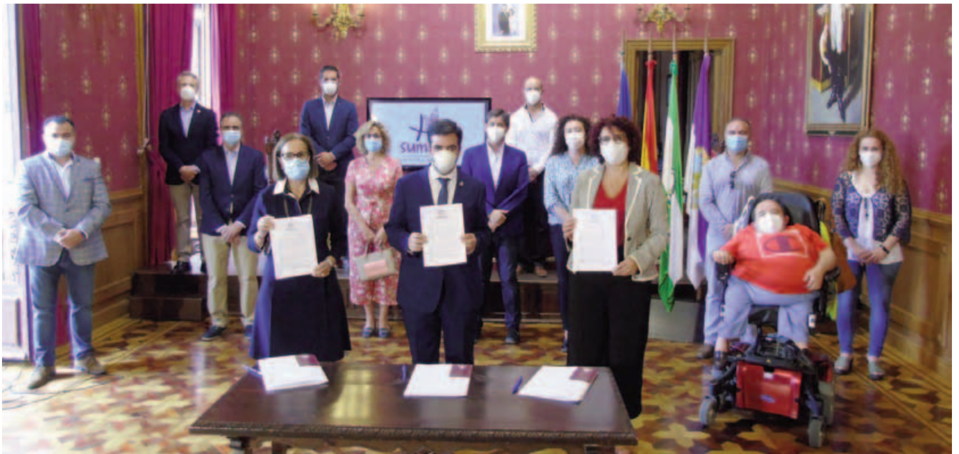
Los corporativos posan con el acuerdo tras la firma del mismo y la explicación de cada una de sus partes.

El plan cuenta con más de 500.000 euros para una decena de medidas de ámbito social y de desarrollo económico con el fin de superar la crisis derivada de la pandemia de la COVID-19