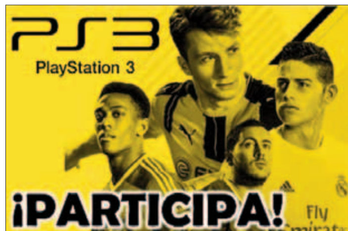
Juventud anuncia un evento online en PS3 para finales de julio.