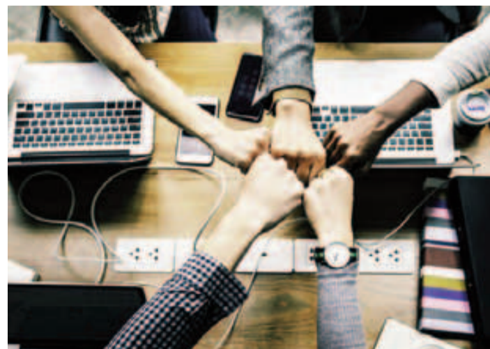
El IAJ oferta talleres en el aula virtual sobre emprendimiento.

El área municipal de Juventud agradeció la colaboración de todos los jóvenes participantes que se sumaron a esta iniciativa de dinamización juvenil, desarrollada a través de la red social que más éxito tiene entre los jóvenes, como es Instagram.