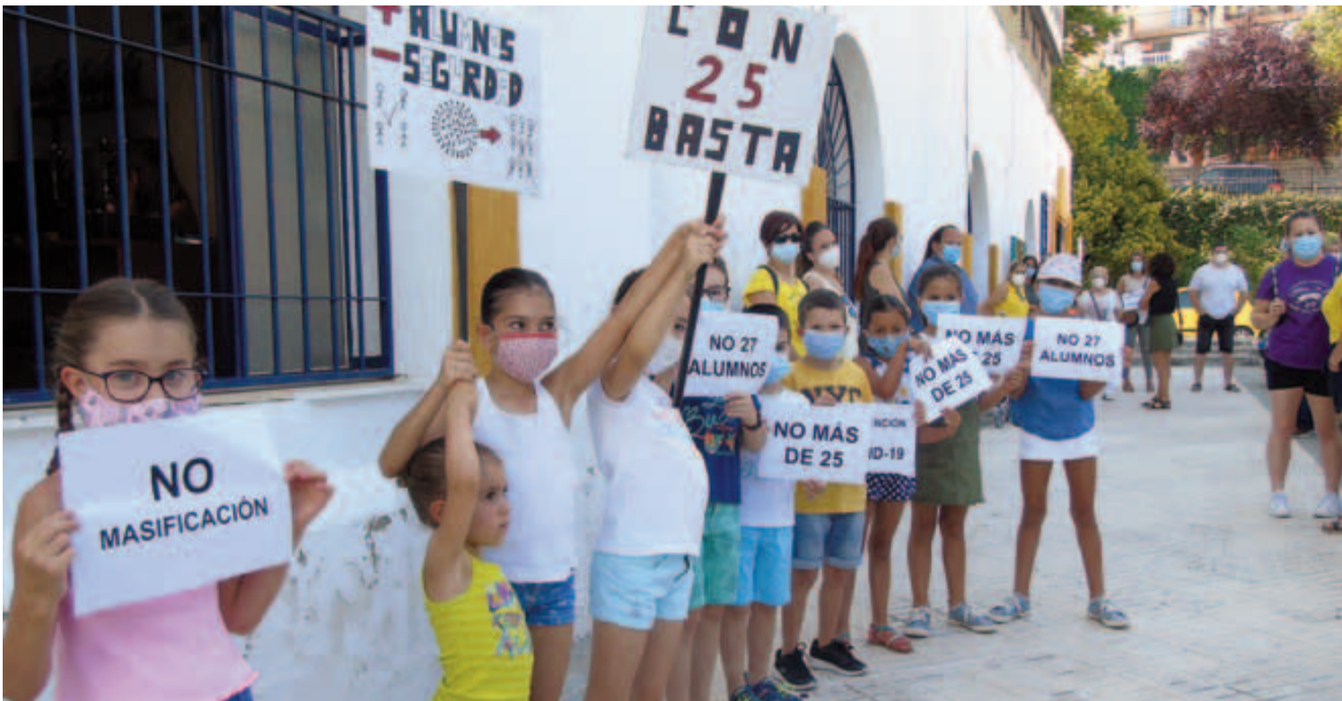
Escolares del CEIP Rafael Pérez del Álamo se concentran contra el incremento de alumnos el próximo curso en la clase de tercero de Primaria.