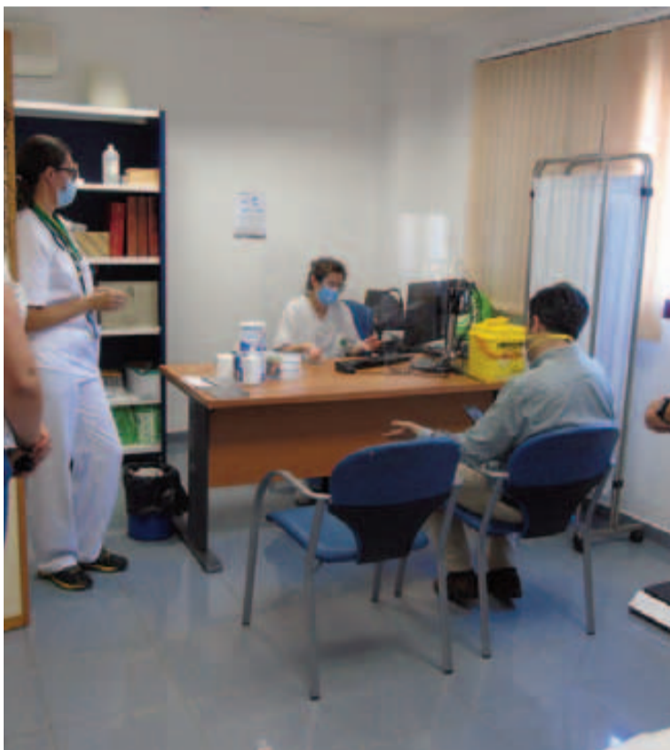
El alcalde visitó el consultorio médico de Cuesta La Palma.

Loja cuenta con consultorios de este tipo en Ventorros de San José, La Fábrica, Fuente Camacho, Ventorros de La Laguna, Riofrío, Ventorros de Balerna y Cuesta La Palma. A esta última